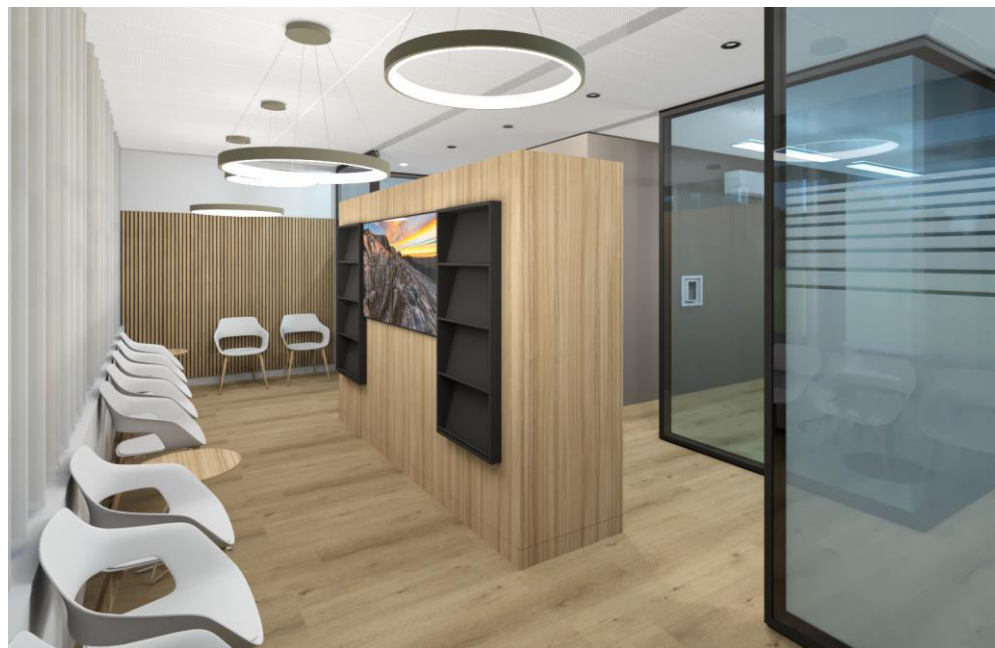
ÄRZTEZENTRUM BELLACH AG, erstellt im Jahr 2024