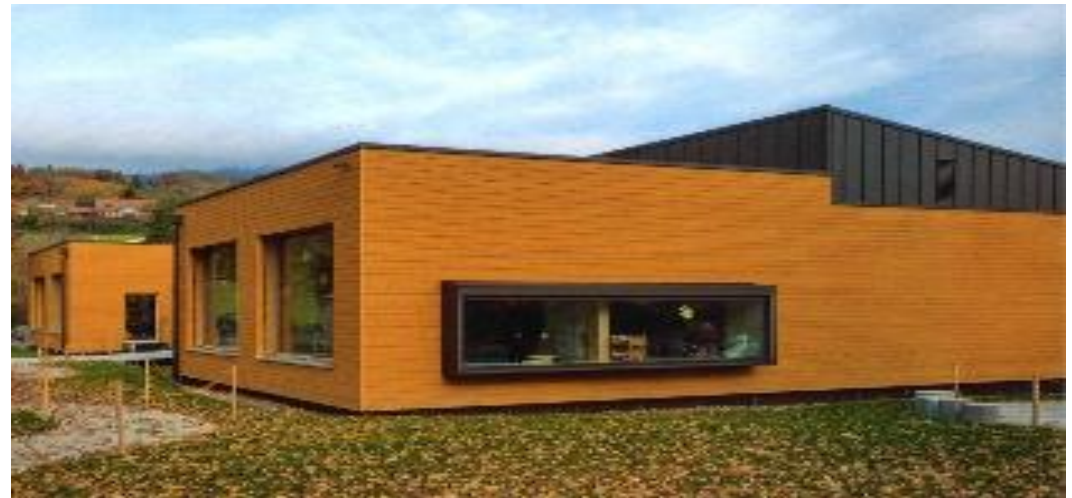
Neubau Kindergarten Kaselfeld 2025